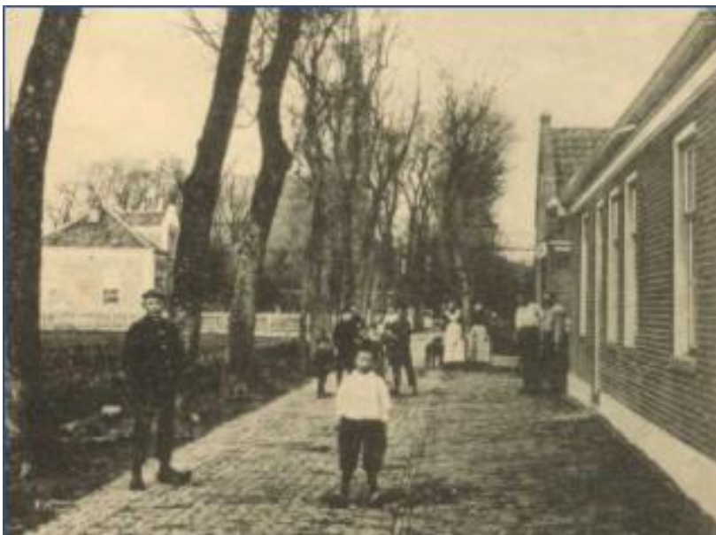
Foto gemaakt omstreeks 1900, bakkerij uiterst rechts