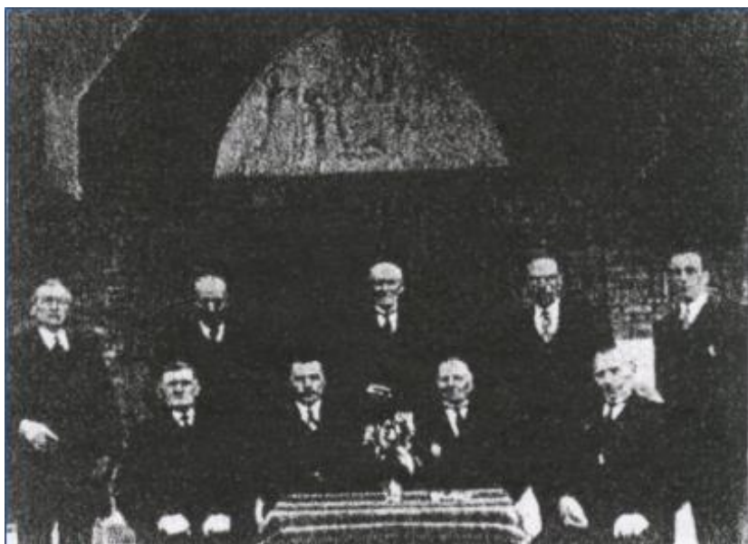
1938 bestuur boerenleenbank De Goorn

Honderd jaar geleden, op 11 maart 1898, werd ten kantore van de Hoornse notaris Petrus Bos de Coöperatieve Boerenleenbank De Goorn/Berkhout opgericht. Een goede aanleiding om ook in dit blad daar op bescheiden wijze aandacht aan te besteden. Ik wil dat doen aan de hand van onderstaande foto waarvan het ingelijste origineel jarenlang bij mijn ouders op zolder lag.