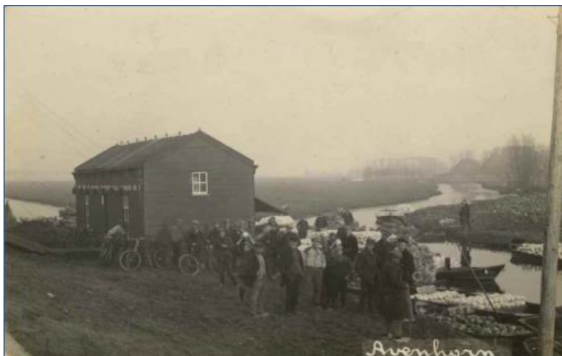
Avenhorn 1 e houten vaarveiling 1917

Op initiatief van tuinder P. De Haan uit De Goorn wordt een buitengewone ledenvergadering gehouden, met het plan een markt te openen in Avenhorn aan het vaarwater op een nader te bepalen plaats.