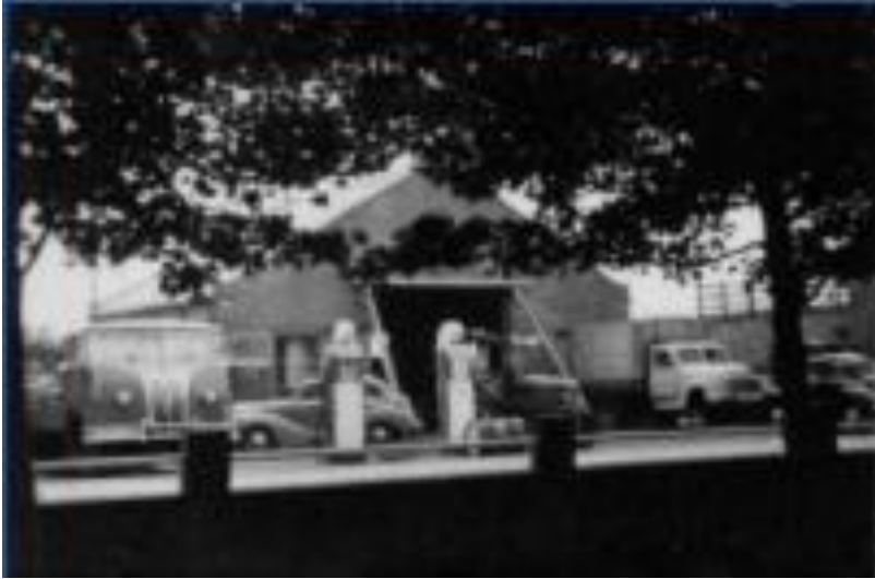
Garage in 1950 gebouwd, gesloopt 1958

Een jaar later, in 1959, werd het dealerschap van DAF verworven en in 1976, juist op het moment dat het bedrijf een tot nu toe laatste uitbreiding had ondergaan, raakte men dat weer kwijt. Dat probleem werd goed opgelost doordat ze altijd de volgende strategie hadden gevolgd: “Iedere klant met welk merk dan ook te helpen.”