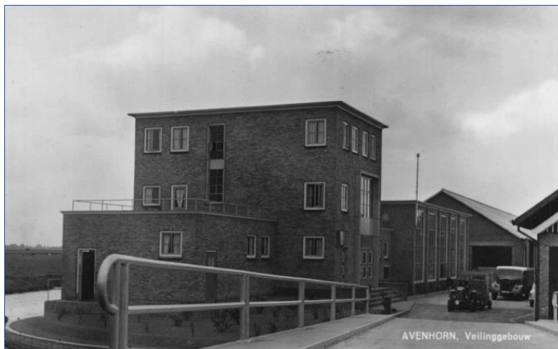
Ingang neerzetveiling 1954.

Achter de neerzethal wordt een koelhuis gebouwd.